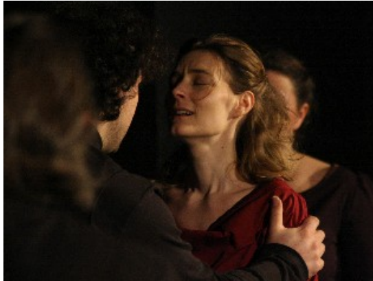
MARIE STUART de Friedrich Schiller Théâtre13 et tournée 2009